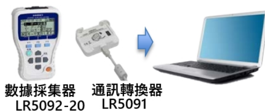
數據採集器 LR5092-20 通訊轉換器 LR5091