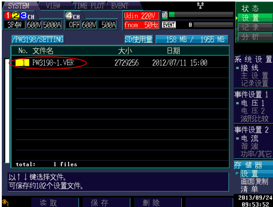
图 2 设置画面